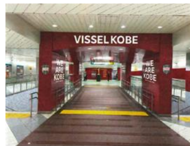
▲ヴィッセル神戸全面装飾（御崎公園駅）