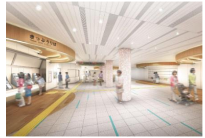
▲改修イメージ (コンコース階)