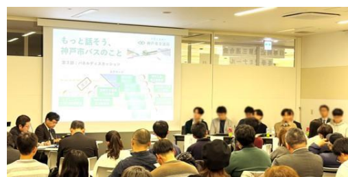
▲市バスフォーラム

路線の課題や将来の可能性を市民と考えるフォーラム等を開催し、収支が厳しい路線の課題を共有し対話を実施することで、持続可能な交通路線網の構築につなげる。