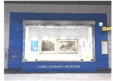
▲神戸サブウェイミュージアム (ハーバーランド駅)

地元企業・団体などと連携して、海岸線沿線の賑わいづくりと利用客増の取り組みを進めるとともに、さらなる魅力づくりとして、関係局と連携して「スポーツ・音楽・芸術」によるブランディング化に取り組む。