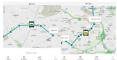
▲新バスロケーションシステム画面